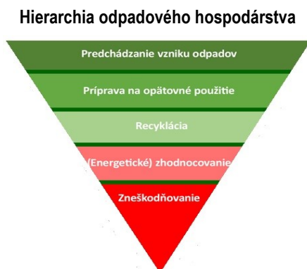
Obrázok č. 1: Nakladanie s plastovým odpadom podľa hierarchie odpadového hospodárstva