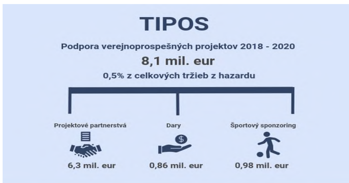
Graf č. 3 Podpora projektov priamo financovaných spoločnosťou TIPOS

Proces rozdeľovania týchto peňazí na konkrétne projekty však podľa NKÚ SR vykazoval prvky nižšej transparentnosti a objektivity. NKÚ SR konštatuje, že spoločnosť TIPOS nemala vo vnútorných smerniciach stanovené konkrétne kritériá, podľa ktorých by sa riadila výberová komisia pri výbere žiadateľa o podporu formou daru a sponzorského. Na výber žiadateľov o vstup do projektového partnerstva nebol zriadený ani kolektívny poradný orgán. Na webovej stránke spoločnosti neboli zverejnené zoznamy úspešných a neúspešných žiadateľov s uvedením požadovanej a schválenej výšky finančnej podpory.