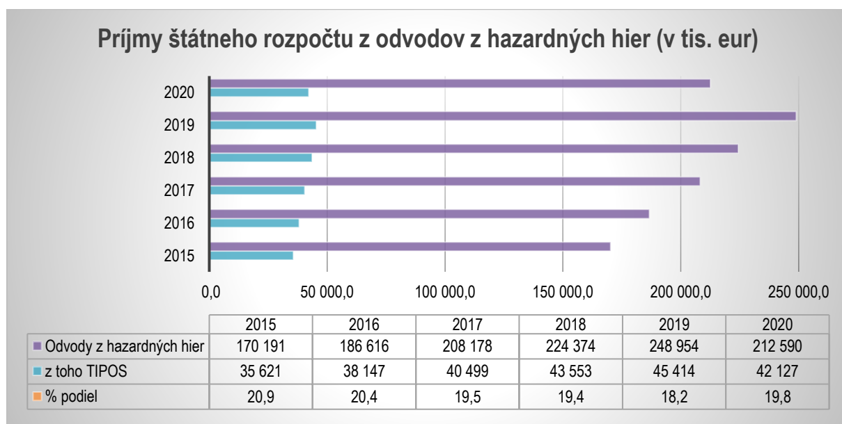
Graf č. 4 Príjmy štátneho rozpočtu z odvodov z hazardných hier (v tis. eur)

V dlhšom časovom horizonte celkový odvod z hazardných hier do štátneho rozpočtu narastal priemerne o 10 % ročne. Z hodnoty 170,2 mil. eur v roku 2015 na 248,9 mil. eur v roku 2019. Najvýraznejšie sa zvyšoval podiel z odvodov z internetových hier v dôsledku masívnej elektronizácie v oblasti hazardu. Zariadenia v herniach postupne prechádzali na vyspelejšie formy videohier, ktoré je možné prevádzkovať len prostredníctvom internetového pripojenia. Na zvyšovanie odvodov malo vplyv aj zvýšenie sadzieb na vybrané druhy hier. Rastúci trend odvodov bol zastavený v roku 2020, najmä z dôvodu nového zákona o hazardných hrách, ktorým boli upravené podmienky prevádzkovania hazardných hier a uzavretia kamenných prevádzok v dôsledku pandémie COVID-19.