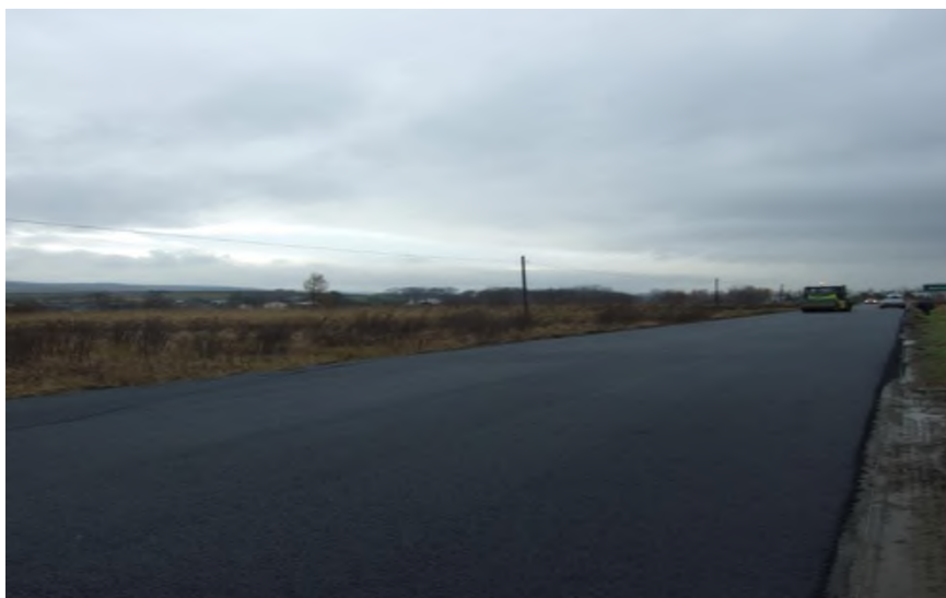
Fragment drogi w Kobylanach

14. Nazwa projektu: Partnerstwo na rzecz budowy systemów kanalizacyjnych w gminach Zarszyn i Pakostov