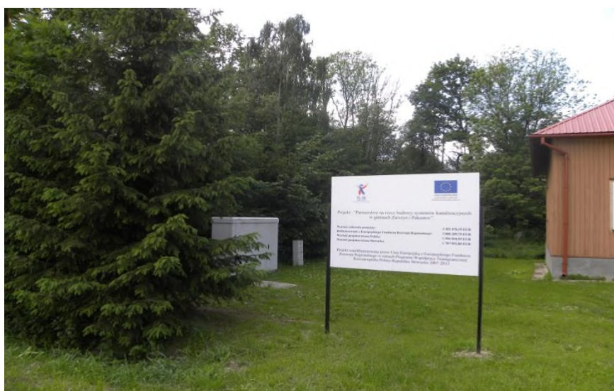
Tablica informacyjna projektu