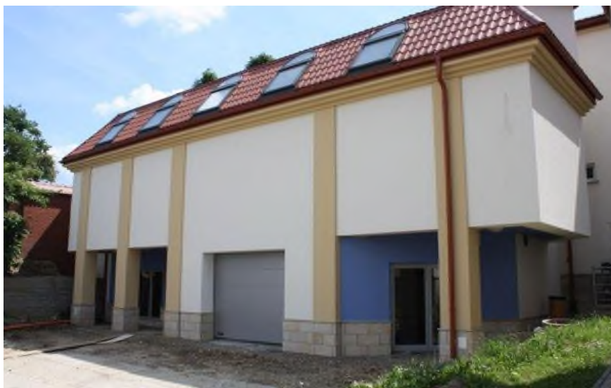
Sanocki Dom Kultury – dobudowana część z salą tańca

13. Nazwa projektu: Rozwój infrastruktury drogowej pomiędzy powiatem krośnieńskim, jasielskim i bardejowskim