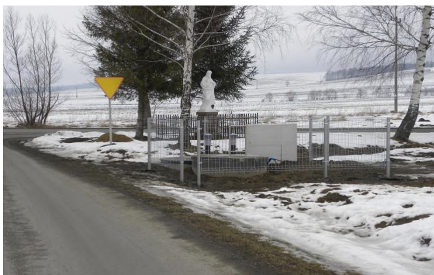
Jedna z przepompowni ścieków