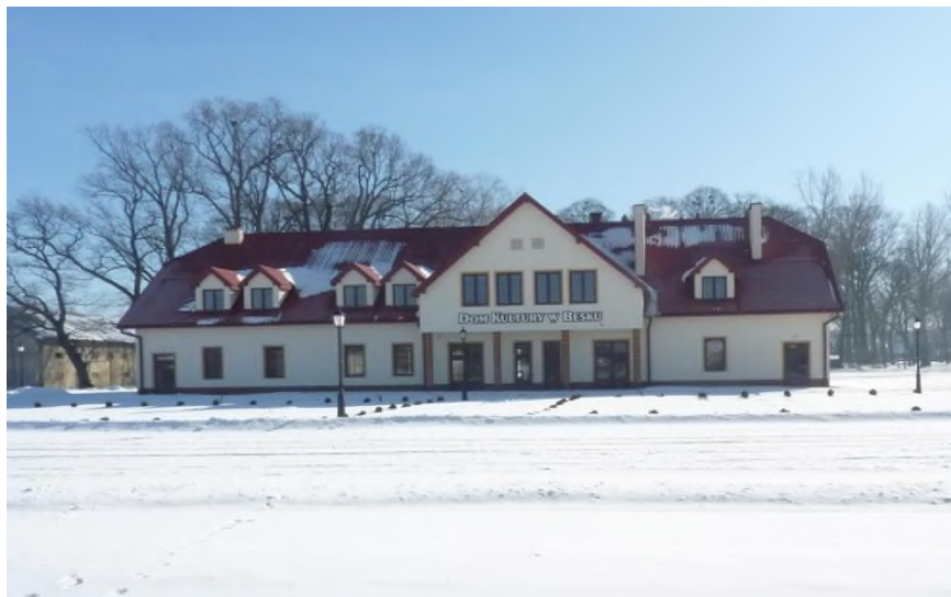
Dom Kultury w Besku

9. Nazwa projektu: Zielone dziedzictwo – Parki Jarosławia i Humennego