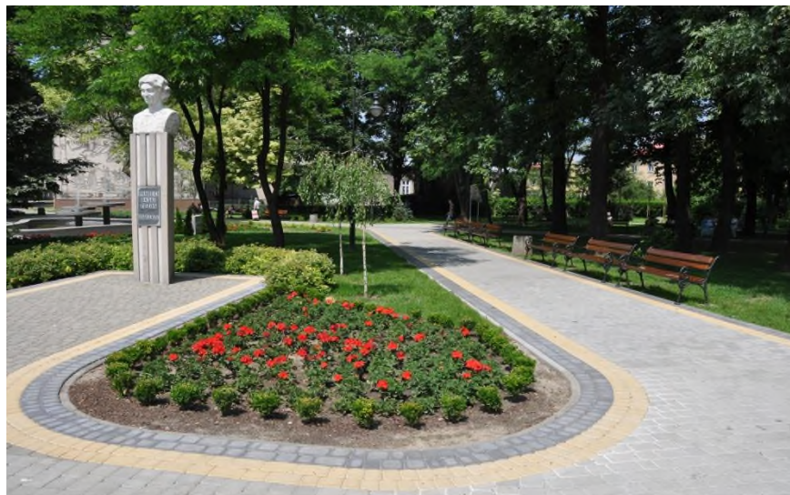
Fragment parku przy ul. Czesławy Puzon w Jarosławiu

10. Nazwa projektu: Dwie Cerkwie – zbliżenie kultur pogranicza Polski i Słowacji