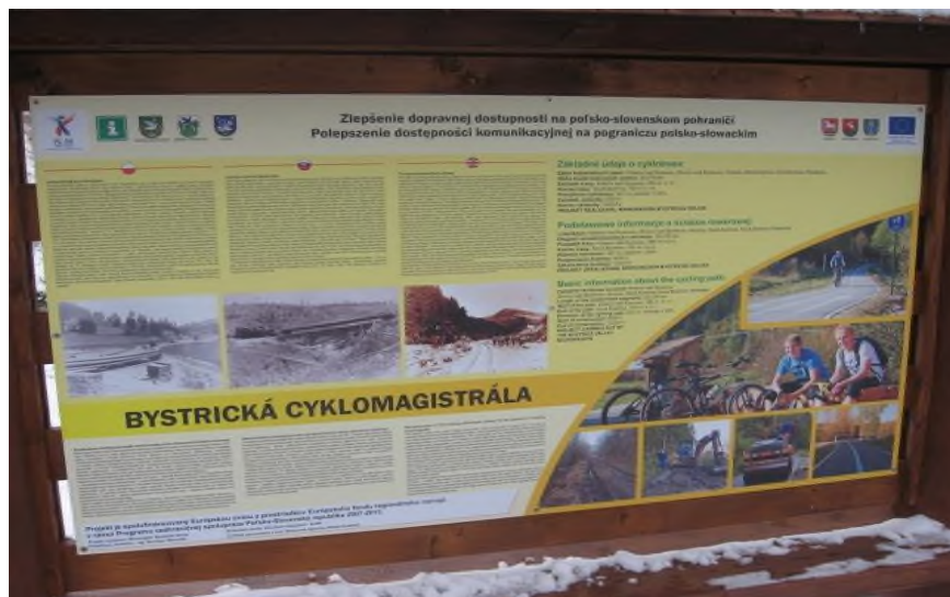
Zdjęcia powyżej – cyklotrasa

8 Nazwa projektu: Kultura bez granic. Budowa i modernizacja polsko – słowackich domów kultury w Gminie Besko i 15 miejscowościach Mikroregionu Koszkovce,