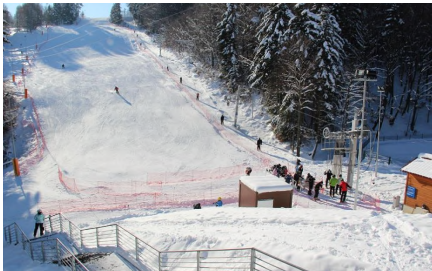
Zmodernizowany wyciąg narciarski w Czarnorzekach