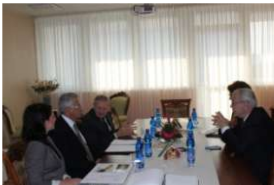
Prijatie delegácie NKI Rumunska

Hlavným prínosom medzinárodných aktivít NKÚ SR bol rozvoj bilaterálnych a multilaterálnych vzťahov s NKI v celosvetovom rozsahu, zvyšovanie kvality a efektívnosti kontrolnej činnosti na základe získavania a výmeny odborných informácií a skúseností, ako aj zvyšovanie medzinárodného kreditu SR v oblasti kontroly.