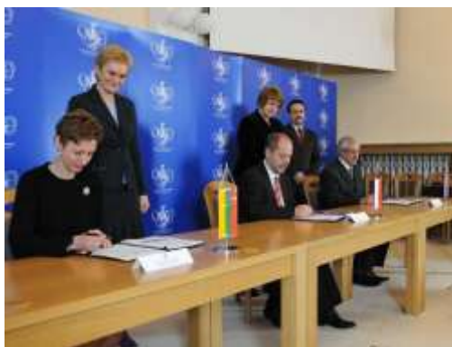
Podpis spoločnej správy NKÚ SR, NKI Poľska a NKI Litvy

Významným prínosom pre NKÚ SR boli praktické skúsenosti získané z medzinárodnej paralelnej kontroly s NKI Poľska a Litvy zameranej na epizootickú bezpečnosť po vstupe do Schengenského priestoru. Predseda NKÚ SR podpísal spoločnú správu z tejto trojstrannej kontroly v decembri vo Varšave.