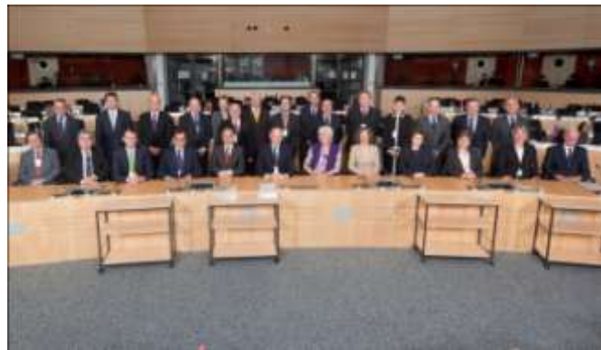
Stretnutie vedúcich predstaviteľov NKI krajín EÚ a EDA v Luxemburgu

NKÚ SR prezentoval pokrok v oblasti výkonu kontroly aj na ďalších medzinárodných podujatiach, napr. na rokovaní prezidentov NKI členských štátov EÚ a EDA v Luxemburgu.