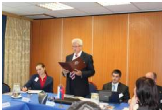
Stretnutie vedúcich predstaviteľov NKI krajín V4, Rakúska a Slovinska v SR

V rámci regionálnej spolupráce, na základe rotácie predsedníctva, zorganizoval NKÚ SR v roku 2010 každoročné stretnutie vedúcich predstaviteľov NKI stredoeurópskych krajín Vyšehradskej skupiny, Rakúska a Slovinska, ktoré viedol predseda NKÚ SR. Predmetom tohto stretnutia bola téma aktivity NKI v období finančnej a hospodárskej krízy, bilaterálna a multilaterálna spolupráca a ďalšie témy. NKÚ SR moderoval viaceré témy, medzi inými aj „úloha NKI v čase hospodárskej krízy“ a pripravil závery z rokovania, ktoré majú ďalšie stretnutia tejto skupiny orientovať na významné témy a rozšíriť spoluprácu, napr. aj formou koordinovaných seminárov.