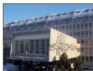
Expozitúra NKÚ SR Trnava