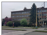
Expozitúra NKÚ SR Prešov