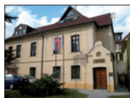
Expozitúra NKÚ SR Banská Bystrica