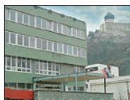
Expozitúra NKÚ SR Trenčín