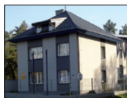
Expozitúra NKÚ SR Košice