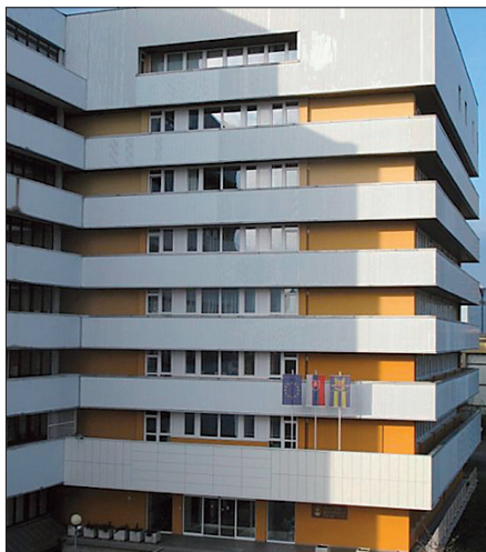
Najvyšší kontrolný úrad SR

Najvyšší kontrolný úrad SR, Expozitúra NKÚ SR Prešov, Expozitúra NKÚ SR Banská Bystrica, Expozitúra NKÚ SR Trenčín, Expozitúra NKÚ SR Bratislava, Expozitúra NKÚ SR Trnava, Expozitúra NKÚ SR Košice, Expozitúra NKÚ SR Žilina, Expozitúra NKÚ SR Nitra