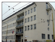
Expozitúra NKÚ SR Žilina