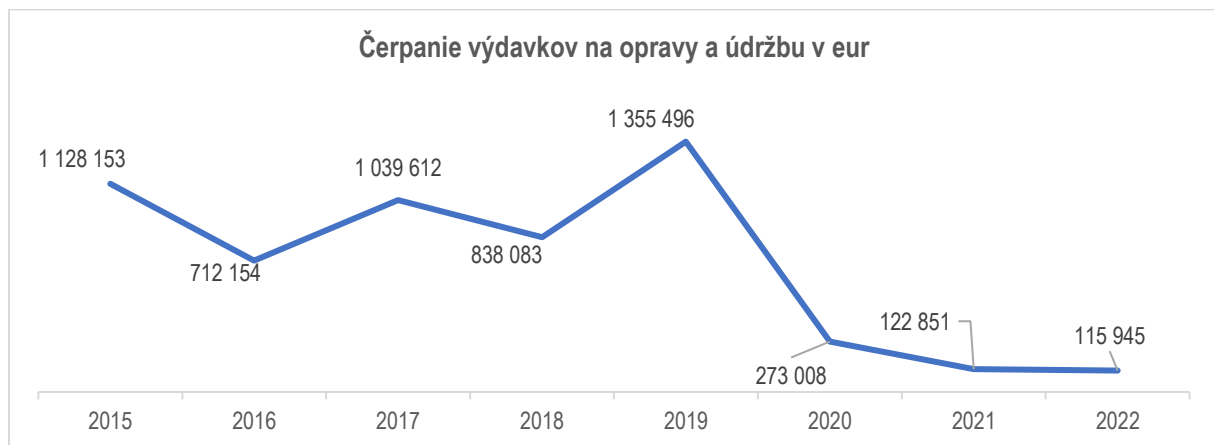
Graf č. 2 Čerpanie výdavkov na opravy a údržbu v rokoch 2015 až 2022 vyjadrené v eurách